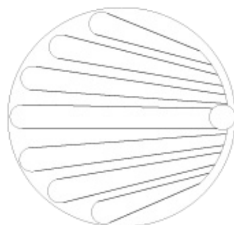
Principskitse af diffusionsrør i gylletank

Diffusionsrørene fordeles på bunden af gylletanken eller gyllekanalerne, hvilket giver en optimal fordeling af ozonen.